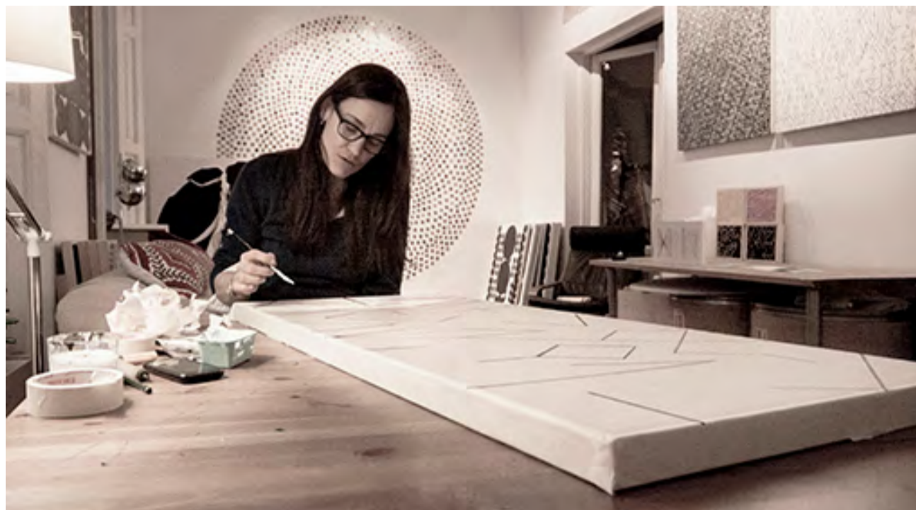
EMILIA AZCÁRATE / CORTESÍA

Negro / Primarios es el nombre de la más reciente exposición de Emilia Azcárate (1964), presentada por Espacio Arte al Cubo (Caracas), en colaboración con la galería Henrique Faría New York. La exposición estará abierta hasta el próximo 16 de agosto