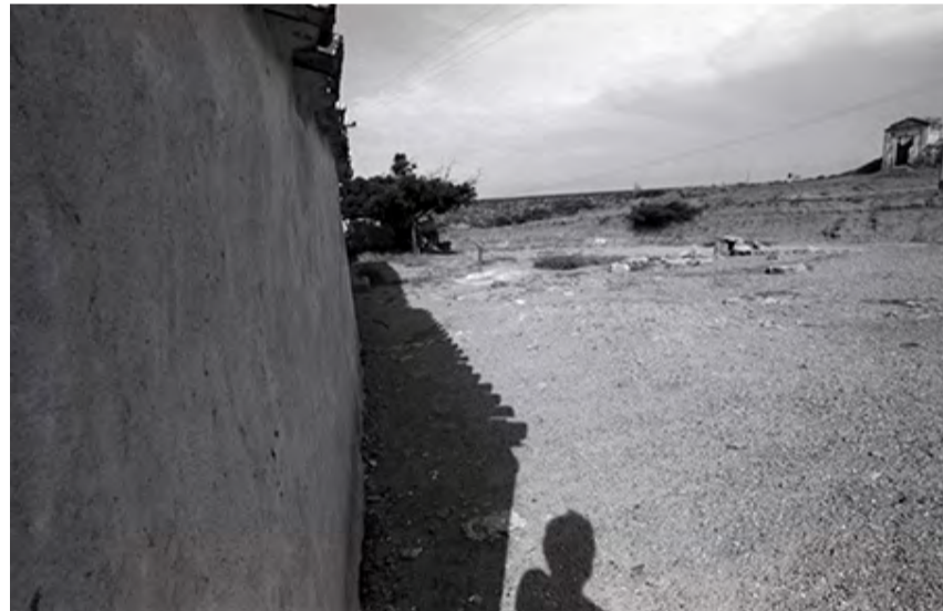
LA CASA DEL MARISCAL. PARAGUANÁ, ESTADO FALCÓN, VENEZUELA, 1986

Otro día yo voy con mis libros y él me dice: "Chamo" -él ya usaba la palabra "chamo" como Ricardo Jiménez