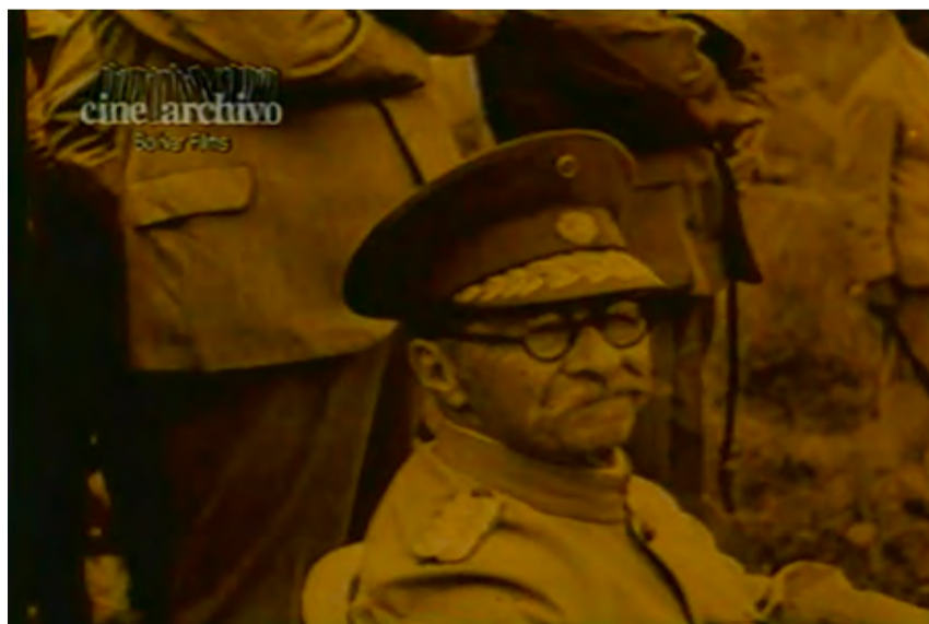
FOTOGRAMA DE JUAN VICENTE GÓMEZ Y SU ÉPOCA / MANUEL DE PEDRO