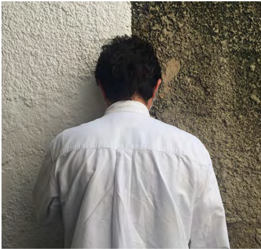
EN LA ONG, CARACAS, VENEZUELA, 2016