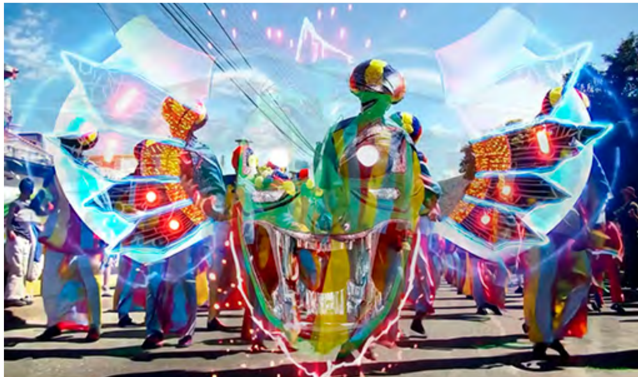
LOOKING FOR A VENEZUELAN FUTURISM (2025) / SEBASTIÁN LLOVERA

Crear representa para muchos una ardua labor –un dolor, incluso. Sin embargo, los creadores la asumen, pues producir es también una manera de sublimar esas penas que no se escogen. ¿Comprenderán las máquinas futuras el impulso de crear? ●