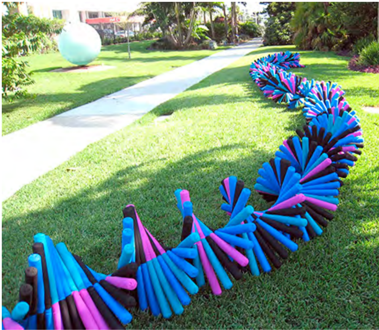
BUCANEER HELIX, 2008, MIAMI BEACH BOTANICAL GARDEN – NELA OCHOA / ©NELA OCHOA

A finales de 1985 regresa a Caracas y retoma viejas experiencias y desarrolla una intensa actividad que termina por aproximar danza, pintura y videoarte: también persiste en el activismo político desde la ladera feminista y desde la ecología. Y junto a ello, el desenfado del medio en que se desenvuelve y donde pueden coincidir lecturas de T. S. Eliot y de revistas literarias de sus amigos, espectáculos en el Teatro Teresa Carreño o en el Teatro Nacional, música clásica y discos de “los duros del rock” en SonoRodven. Desde entonces han transcurrido casi cuarenta años de actividad artística.