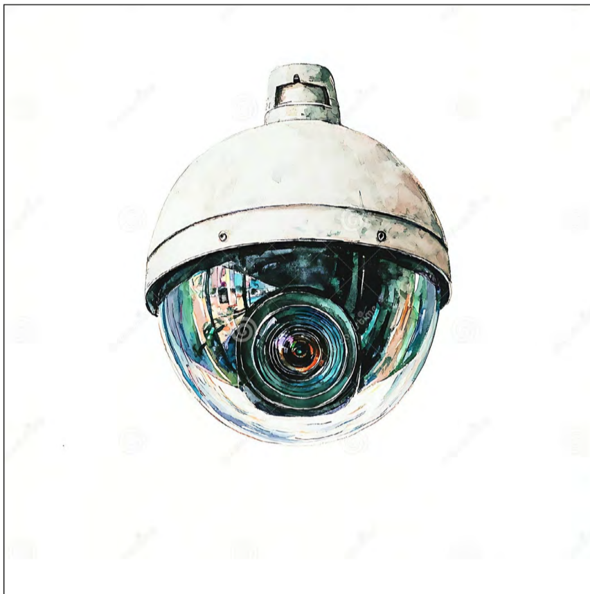
CÁMARA DE SEGURIDAD / GENERADA CON IA

de nuestro corazón, nuestros niveles de azúcar y colesterol, nuestro comportamiento durante sueño y vigilia. Somos transparentes a todos los médicos del mundo, hospitales, compañías de seguros, bancos y corporaciones farmacéuticas y de equipos médicos. Y de la Nube al mundo, Urbi et Orbi .