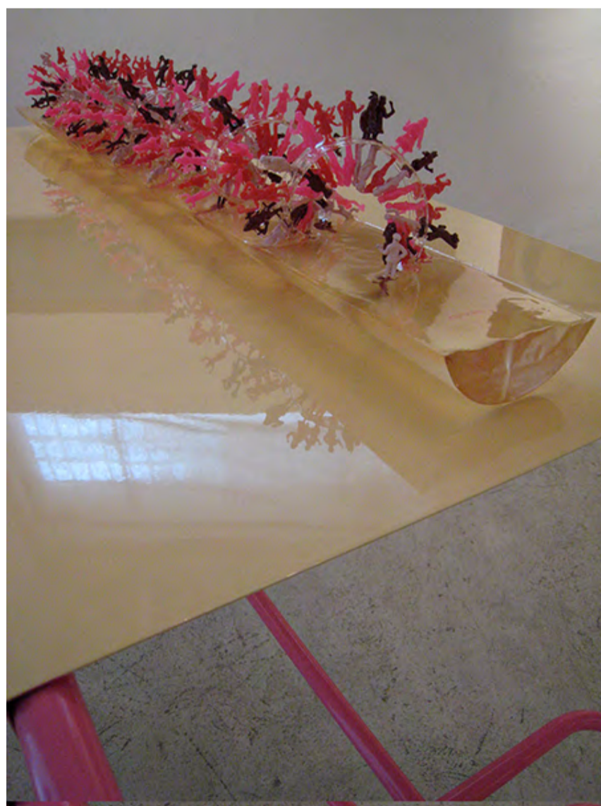
FÓSIL (DETALLE), 2010 – NELA OCHOA

cias genéticas relacionadas con el cáncer de mama en BRCA (2001) y de secuencias del algodón en Semillas del matadero (2002), de la relación ATCGN del pétalo de la rosa en Ni con el pétalo (2004), o hace algo similar con Gen Hibiscus (2006). Diversas obras adquieren entonces este perfil. A veces se trata de encadenamientos de letras que pueden corresponder con hallazgos en el ámbito molecular; otras, de series que trasladan un orden secuencial genético: trabas del sujetador, cucharillas coloreadas, unos dedos plásticos con uñas pintadas... Órdenes repetitivos y secuencias: así se desarrolla una obra que crece sobre la memoria de las series de Warhol, de las experimentaciones cinéticas, del ready-made multiplicado... Así despliega una trayectoria en constante corsi e recorsi sobre motivos e ideas. Su sintaxis de letras se presenta, sin embargo, con estructuras visuales equivalentes a los tapices de letras de Paul Klee y del povera