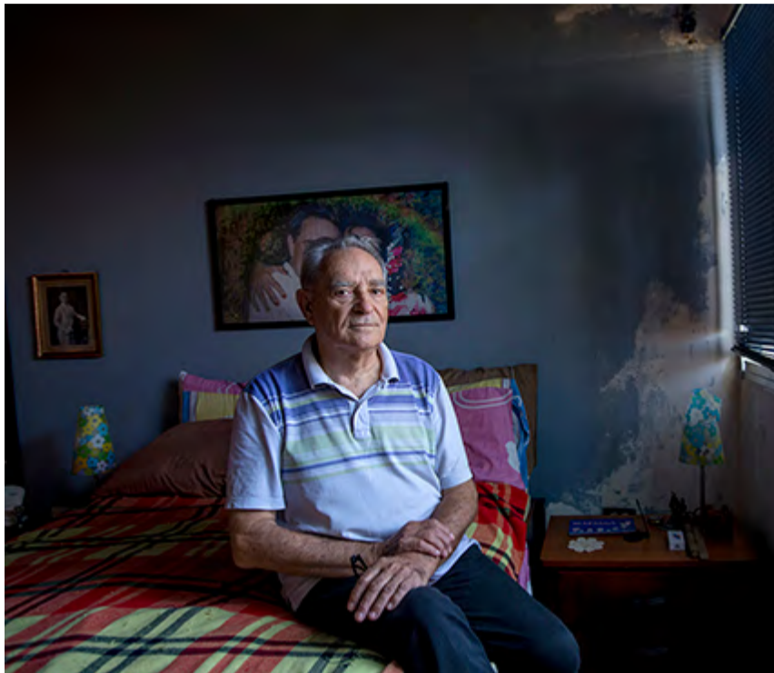
MANUEL DE PEDRO

Manuel de Pedro (1939-2023) estudió Filosofía en España y Cine en Estados Unidos. A comienzos de los años 70 se estableció en Venezuela. Dirigió películas como Juan Vicente Gómez y su época , Iniciación de un shamán , Trampa para un gato y En Sábana Grande siempre es de día , entre otras. Además hizo documentales, dirigió telenovelas y fue profesor universitario