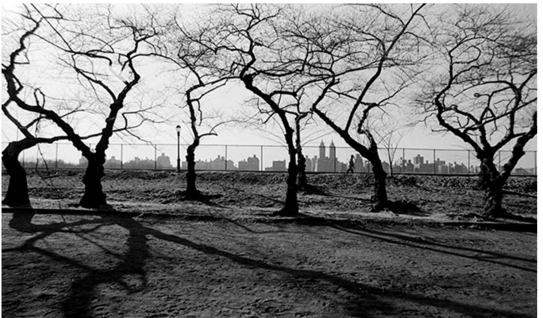
PARQUE CENTRAL, MANHATTAN, NUEVA YORK, 1980